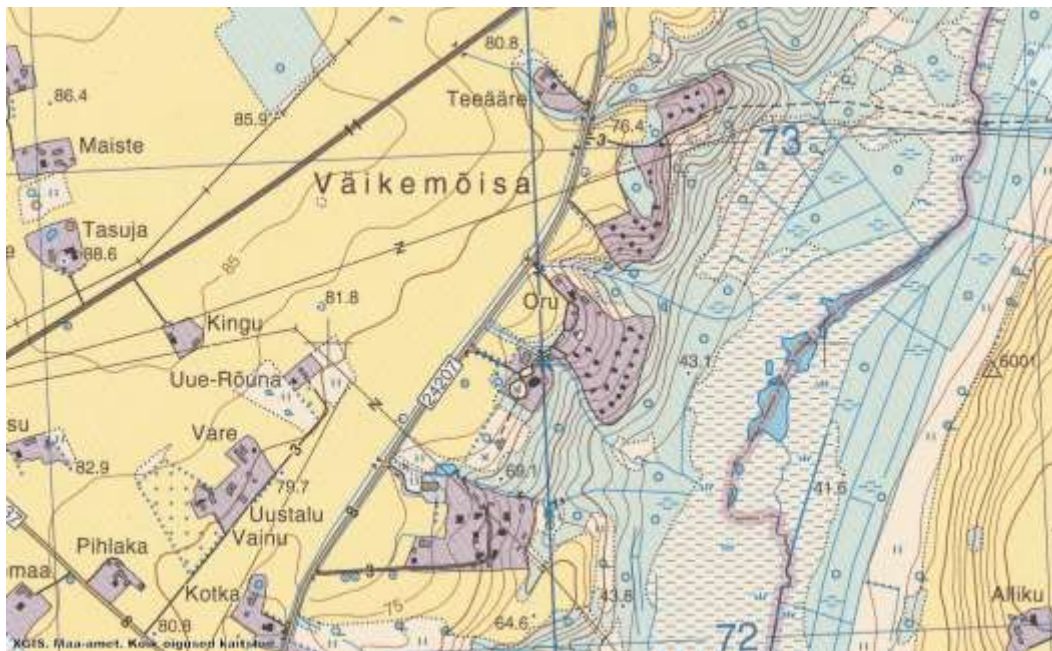
Kaart 4 – Eesti Vabariigi põhikaart 1994-2000

Krundistruktuuri muutused ei ole omanud väga suurt kahjustavat mõju mõisa algele hoonestusele, küll on kompleks kaotanud seetõttu, et maa-ala suvilatega ja väikeelamutega hoonestamine osaliselt likvideeritud ja lahutanud kompleksist kui kaitstavast väärtusest põhjapoolse maanteele kulgenud allee.