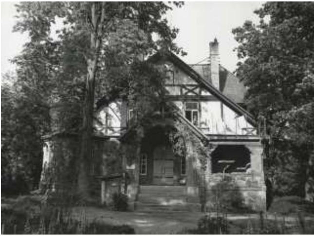
Foto 4 – Vaade peahoone edelafassaadile (1978), autor Juhan Maiste 4