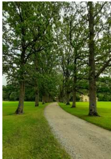
Fotod 9 ja 10 – Vaated peahoone suunas piki alleed (05.09.2020), vaatesuunad vt joonisel 2

Mõisa pargiosa ei ole olnud kuigi suur ja see on säilinud algsetes piirides (vt kaardil 4).