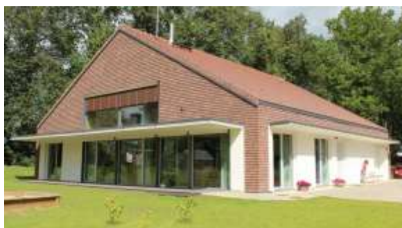
Fotod 7 ja 8 – Vaated avatud peremajadele (2012) 8 , vaatesuunad vt joonisel 2

01.05.2012 võttis Viljandi lasteabi- ja sotsiaalkeskuse töö üle Viljandimaa Omavalitsuste Liidu poolt loodud sihtasutus SA Perekodu, mis on hoone haldajaks tänaseni. 7