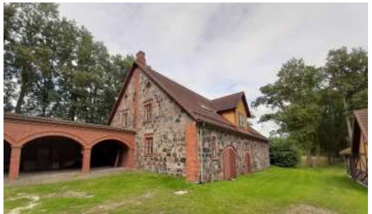
Foto 6 – Vaade abihoonete kagust (05.09.2020), vaatesuund vt joonisel 2

Eesti mõisaportaali andmetel valmis mõisa juugendsugemetega heimatstiilis peahoone 1902. aastal. 5 Mõisa hoonete püstitamise samasse aega jääb juurdepääsuteede (alleed) rajamine ning peahoone trepi esise ringteega mõisapargi rajamine. Lisaks ringtee toredusele ja stiilsusele oli sellel ka vägagi praktiline otstarve - see võimaldas tõllaga sõita mõisa peahoone trepi ette nii, et sealt sai ära sõita teist haru pidi. Ringtee rajati, sest hobustega tagurdamine ei olnud niisama lihtne, kui see on tänapäeval autoga.