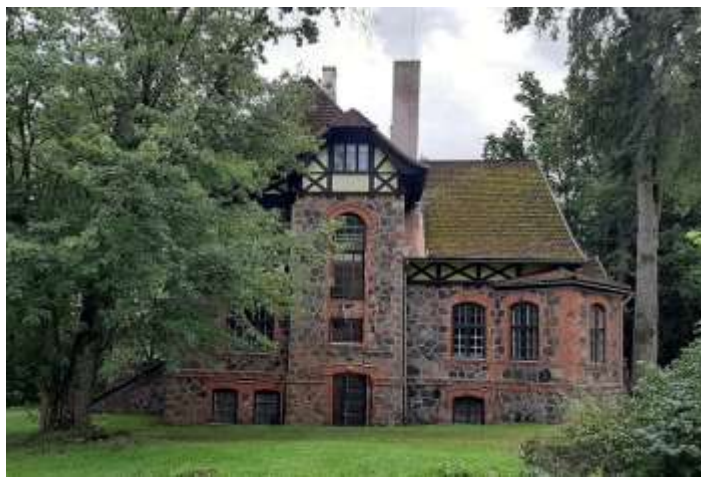
Foto 3 – Vaade peahoone loodefassaadile (05.09.2020), vaatesuund vt joonisel 2