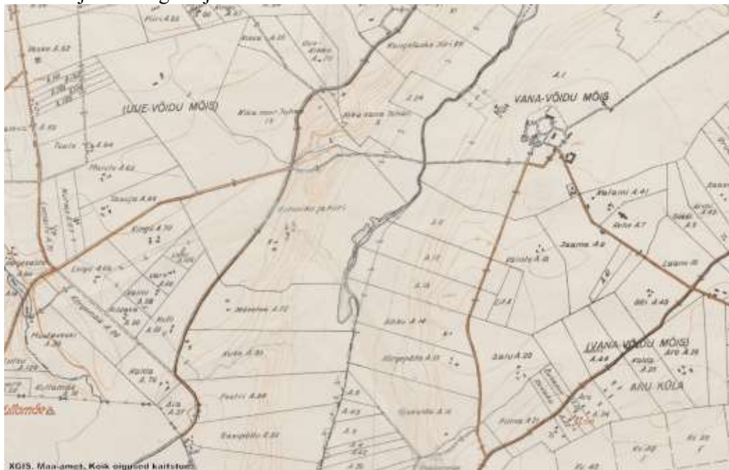
Kaart 3 – Rutniku ja Piiri maauksus, katastrikaart 1931-1944

Mõisa rajamise aegne ajalooline krunt ei ole säilinud.