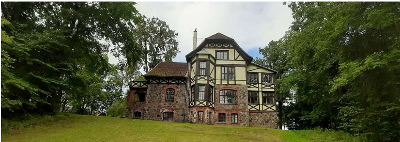
Foto 11 – Vaade peahoone kagufassaadile (05.09.2020), vaatesuund vt joonisel 2

Mõisahoonne on kõige paremini vaadeldav mõisa kinnistult, vaatesuundadelt, mis avanevad hoonest kagus edelas ja loodes.