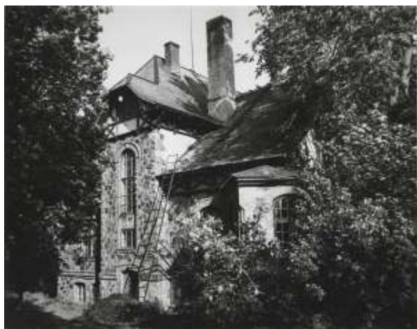
Foto 2 – Vaade peahoone loodefassaadile (1978) 3